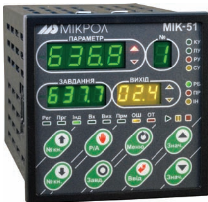
Рис. 3. Многофункциональный контроллер МИК-51

Как на промышленных предприятиях Украины, так и за ее пределами, продукция «МИКРОЛ» (г. Ивано-Франковск, www.microl.ua ) известна довольно давно. Она зарекомендовала себя как надежное, многофункциональное и, самое главное, недорогое решение, подходящее для реализации задач как разработки и