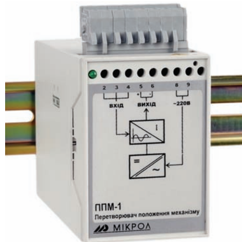
Рис. 6. Преобразователь положения механизма ППМ-1

На сегодняшний день приборы «МИКРОЛ» успешно функционируют на многих электростанциях Украины: Бурштынской ТЭС, Запорожской ТЭС, Добротворской ТЭС, Криворожской ТЭС, Кураховской ГРЭС, Луганской ТЭС, Харьковской ТЭЦ-5, Хмельницкой АЭС, Херсонской ТЭЦ и т.д. МА