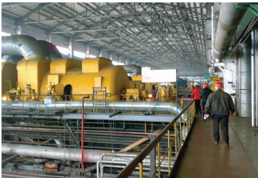
Рис. 1. Машинный зал Бурштынской ТЭС

Такой переход становится еще более очевидным и с точки зрения необходимости реализации централизованной системы управления на базе SCADA-системы, ведь старые аналоговые регуляторы попросту не имеют цифровых интерфейсов.