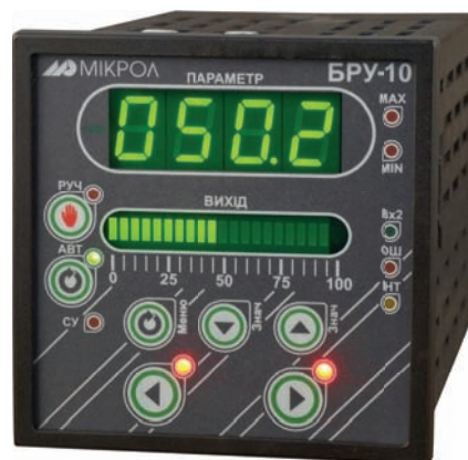
Рис. 5. Блок ручного управления БРУ-10

Указанную модернизацию можно беспрепятственно проводить в несколько этапов, по мере выделения средств, готовности технологического оборудования и обслужи-